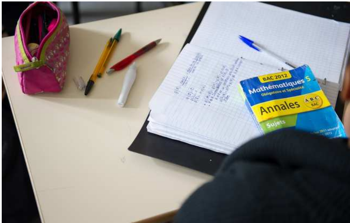
Limay le 03 avril 2012. Illustration lycée Condorcet à Limay dans les Yvelines. Classe. Elèves de Terminale S. Groupe de travail. Annales du bac